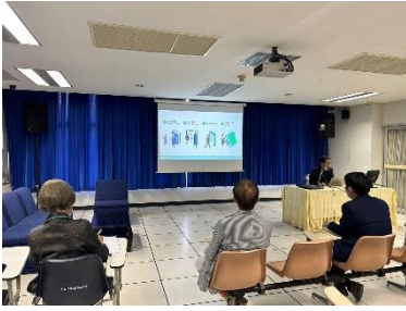
การนำเสนอวิสัยทัศน์ของผู้เข้ารับการสรรหา เป็นผู้สมควรดำรงตำแหน่งผู้อำนวยการสำนักหอสมุดกลาง