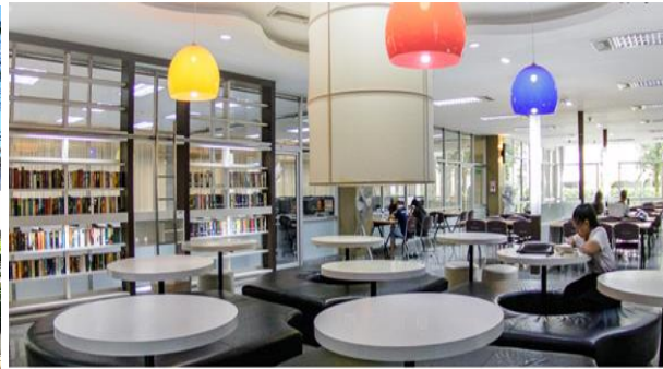
ภาพอาคารสถานที่ สำนักหอสมุดกลาง มหาวิทยาลัยศิลปากร พระราชวังสนามจันทร์ จังหวัดนครปฐม